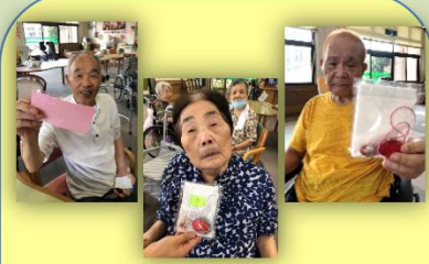
景品の プレゼント